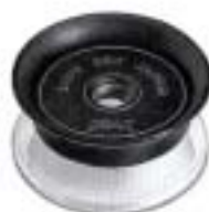
1996 Lupe 30X