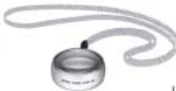
1997 Hand Lupe 3X