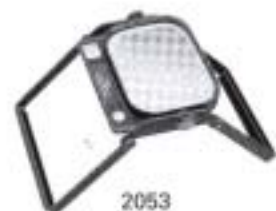
2053 Folding Lupe