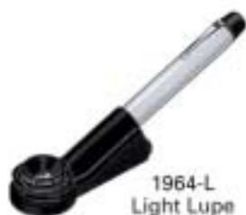
1964-L Light Lupe 22X