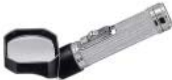
1987 Light Lupe 3.5X