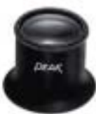
2048 Eye Lupe (A13D) (A16D) (A20D) (A26D)