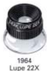
1964 Lupe 22X