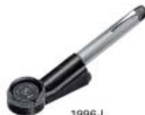
1996-L Light Lupe 30X