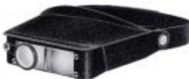
2035-II Head Lupe II