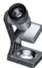
2030 Enlarging Focuser III