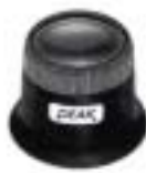
2048 Eye Lupe (V13D) (V16D) (V20D) (V26D)