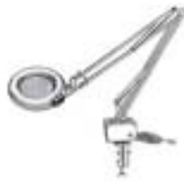
1977-C P.I.L. C