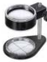
2052 Scale Lupe 3X