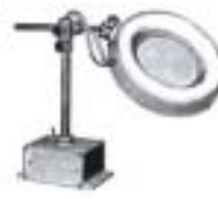
1977-D P.I.L. D