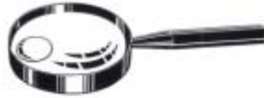
1989 Parasite Lupe