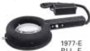
1977-E P.I.L. E