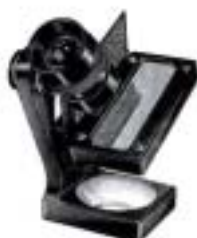
2000 Enlarging Focuser I