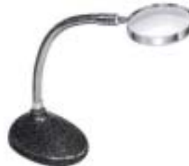
2033-90 Flexible Stand Lupe 90 2033-100 Flexible Stand Lupe 100 2033-115 Flexible Stand Lupe 115