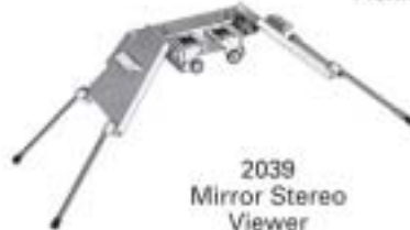
2039 Mirror Stereo Viewer