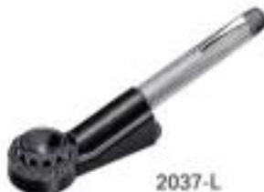
2037-L Light Scale Lupe 30X