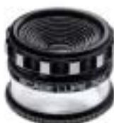
2037 Scale Lupe 30X