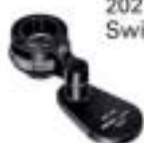
2021-22 Swing Lupe 22X