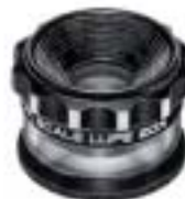
2055 Scale Lupe 20X