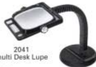
2041 multi Desk Lupe