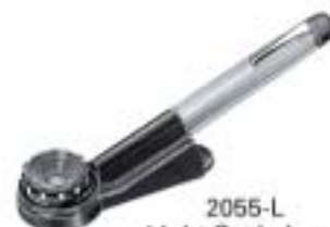
2055-L Light Scale Lupe 20X