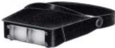
2035-I Head Lupe I