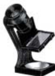
2020 Enlarging Focuser II