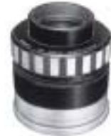
1990-4 Anastigmat Lupe 4X