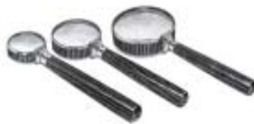
2022-35 Achroma Lupe 35 2022-55 Achroma Lupe 55 2022-75 Achroma Lupe 75