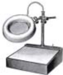
1977-B P.I.L. B