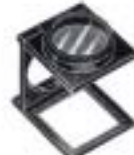
2003 Linen Tester (2003 WA3)