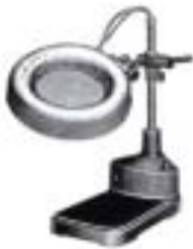
1977-A P.I.L. A