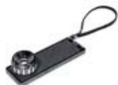
2026-20 Microfilm Viewer 20X