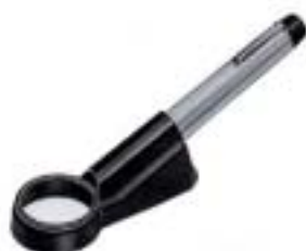
2008-LH Light Holder for Stand Microscope