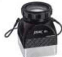
2038 Lupe 4X