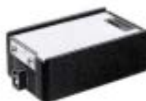
2046 Light Box